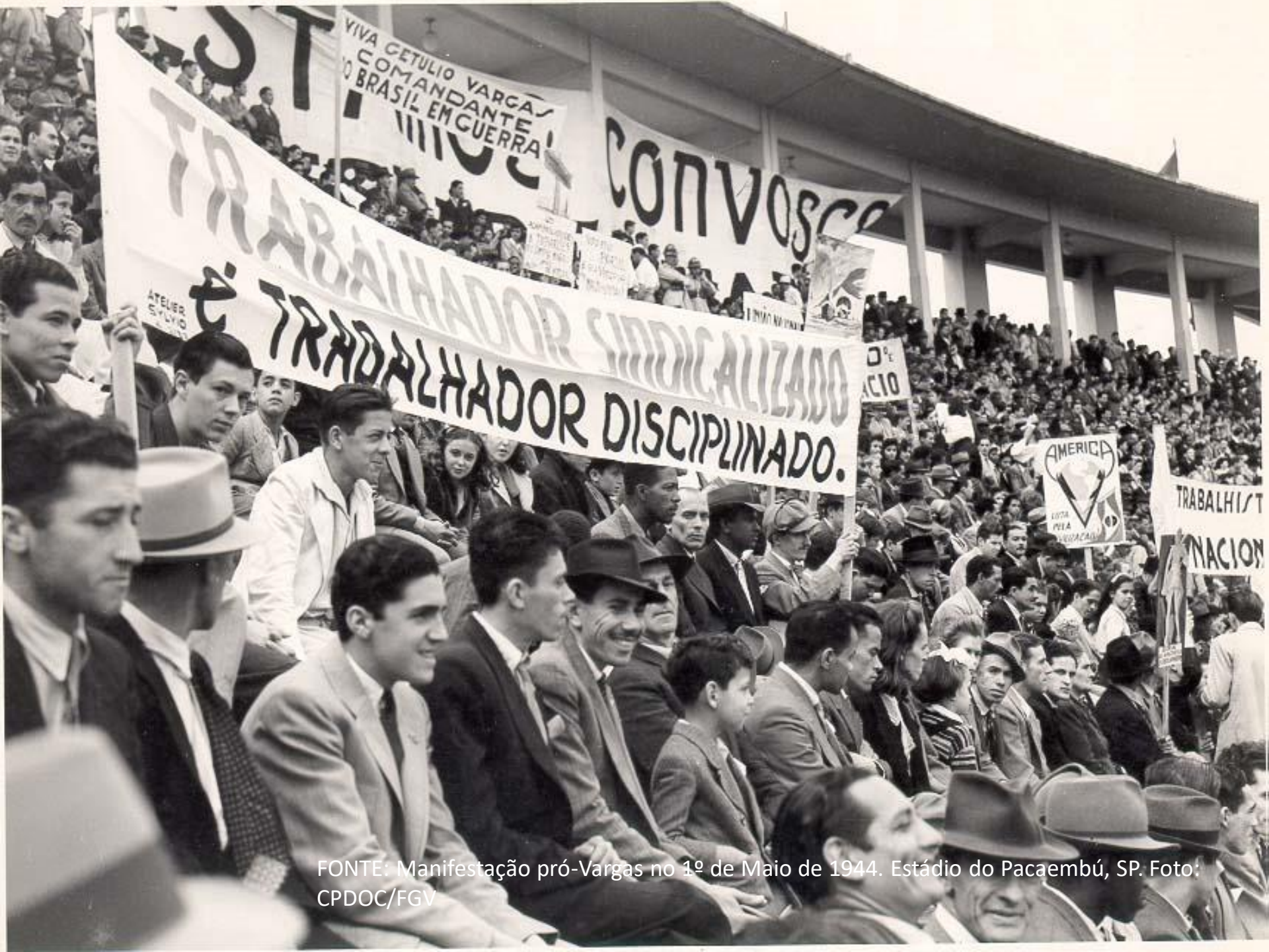
FONTE: Manifestação pró-Vargas no 1º de Maio de 1944. Estádio do Pacaembú, SP. Foto: CPDOC/FGV