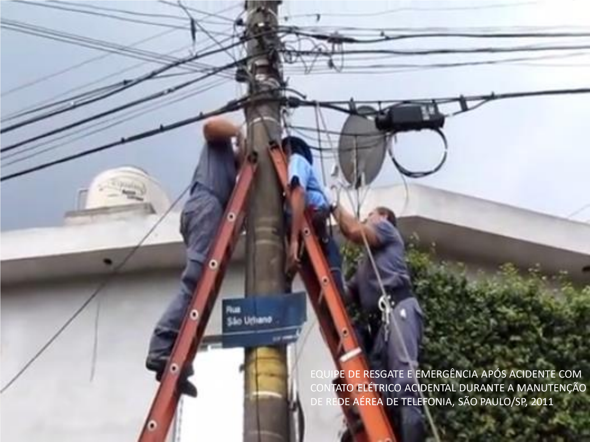
EQUIPE DE RESGATE E EMERGÊNCIA APÓS ACIDENTE COM CONTATO ELÉTRICO ACIDENTAL DURANTE A MANUTENÇÃO DE REDE AÉREA DE TELEFONIA, SÃO PAULO/SP, 2011